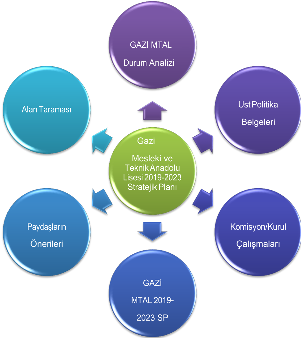
Şekil 1. Stratejik Plan Oluşum Şeması